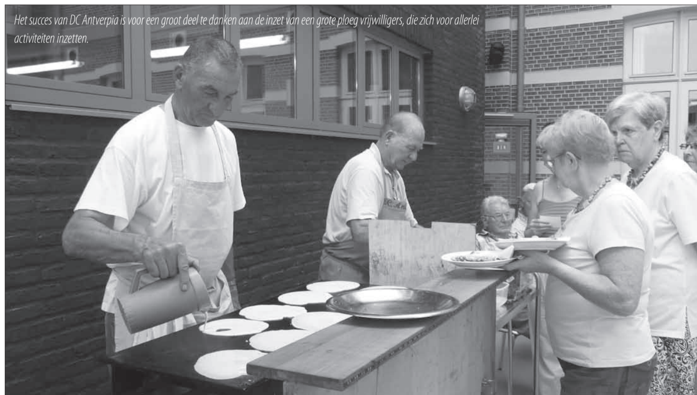
Het succes van DC Antverpia is voor een groot deel te danken aan de inzet van een grote ploeg vrijwilligers, die zich voor allerlei activiteiten inzetten.

En nu op naar de viering van het 10-jarig bestaan in 2016! (WL)