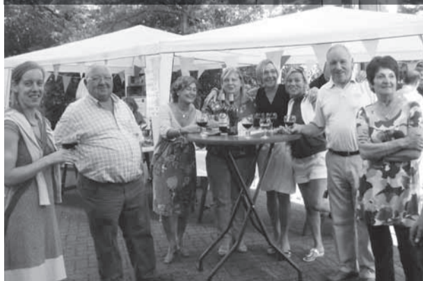
Het tiende straatfeest van de buurt Vredelei-Floris Verbraekenlei groeide weer uit tot een gezellige happening.

Onvergetelijk was het eerste weekend van augustus weer de 'Velo Classic', een evenement waar Sint-Mariaburg trots op mag zijn en waarover meer op sportbladzide 7.