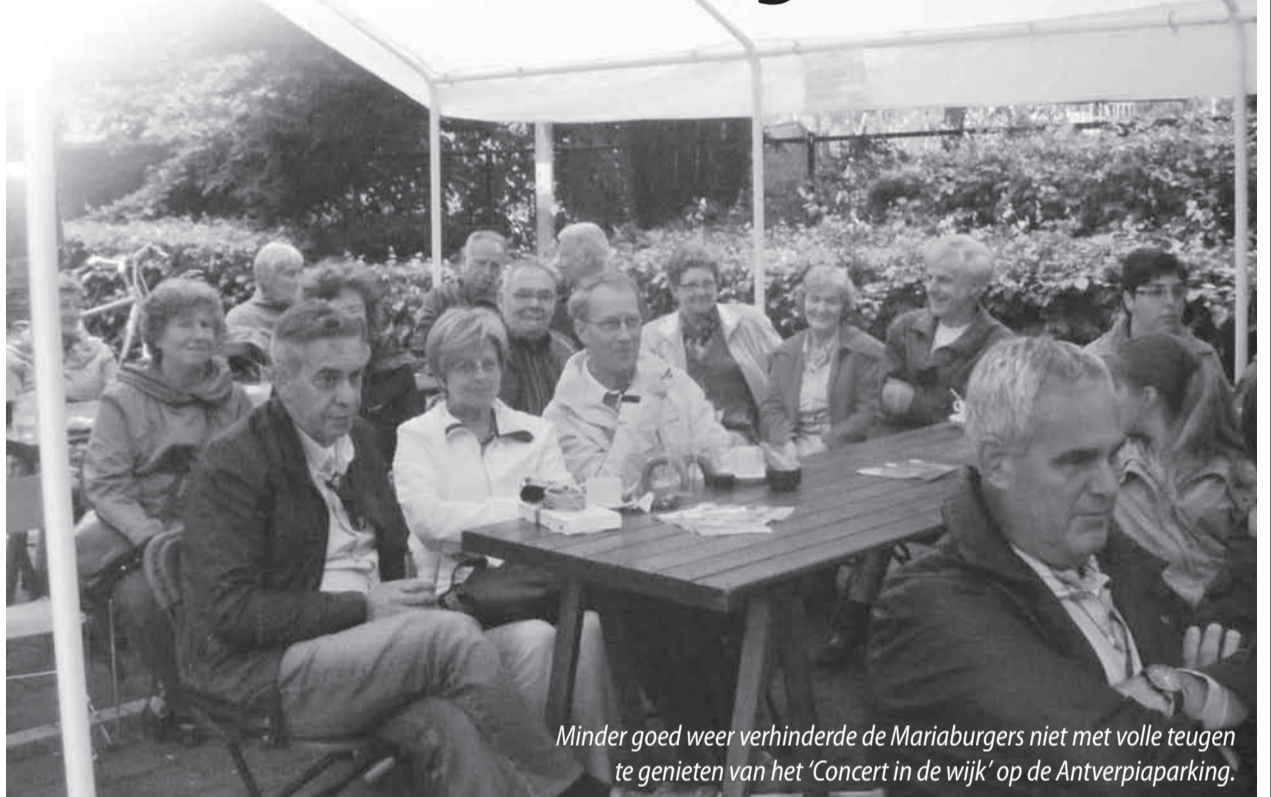
Minder goed weer verhinderde de Mariaburgers niet met volle teugen te genieten van het 'Concert in de wijk' op de Antverpiaparking.