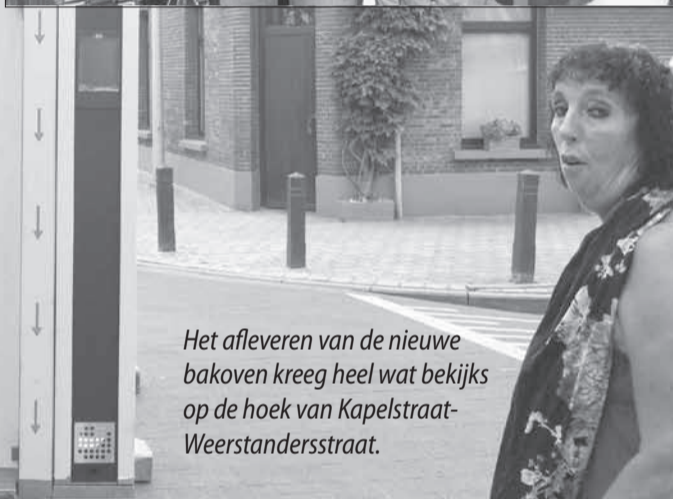
Het afleveren van de nieuwe bakoven kreeg heel wat bekijks op de hoek van Kapelstraat-Weerstandersstraat.