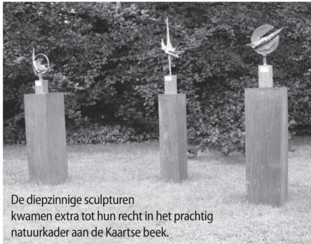
De diepzinnige sculpturen kwamen extra tot hun recht in het prachtig natuurkader aan de Kaartse beek.

Een unieke ervaring, deze tentoonstelling bij Palmen! Beslist voor herhaling vatbaar. Mits wat meer publiciteit vooraf, zeker voor een grote groep kunstliefhebbers een aanrader in de toekomst. (LVB)