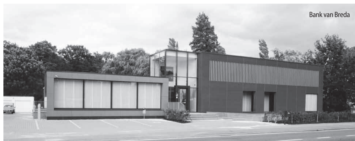
Bank van Breda

Na langdurige verbouwingen is tegenover Delhaize een prachtige constructie verrezen. Waar destijds bloemenzaak Alpina wijd en zijd vermaard was, is thans een zetel van de Bank van Breda gevestigd. (LVB)